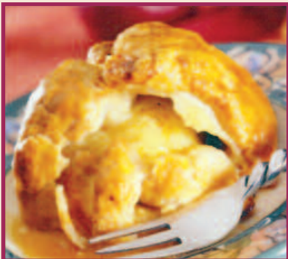
Apple Dumpling A whole fresh apple, wrapped in flaky pie crust with a touch of sugar and spice. $3.59