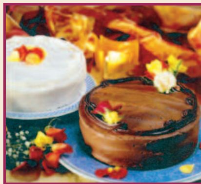
Homemade Cakes Slice of Chocolate or White Cake. $3.59