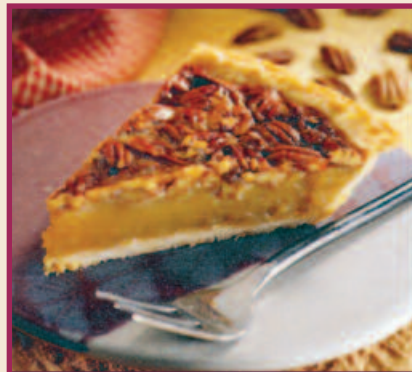
Pecan Pie A generous covering of pecans accent the top of this traditional rich pecan filling baked in a flaky crust. $3.59