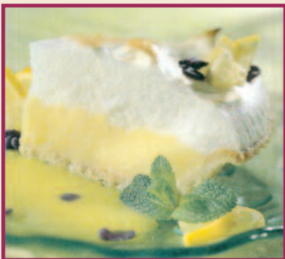
Lemon Meringue Pie Zesty lemon filling piled high with rich egg white meringue. An all time favourite! $3.59