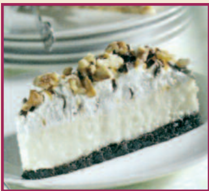
Turtle Cheesecake New York Style cheesecake topped with all your favourites...caramel, pecans and chocolate. $3.79